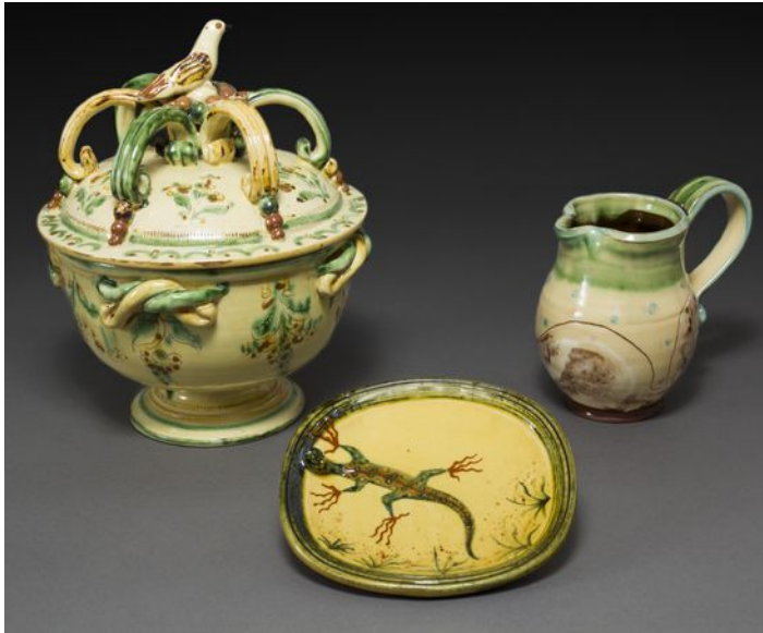
Sourdive, Bailleux, Hostein