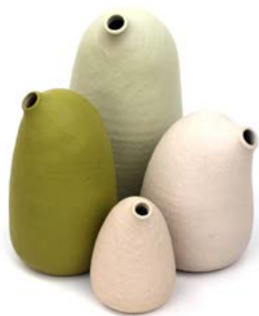
Bouteilles grès engobé, tournage et colombins, 2019-2020