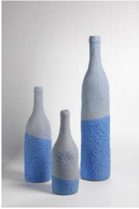
Bouteilles, h. 29, 36 et 55 cm, grès émaillé, 2020

International de Céramique de Faenza. Puis son itinéraire l'amène à vivre, travailler et exposer successivement en France, au Venezuela, au Brésil et en Suisse. Depuis 1995, il a établi son atelier dans la Sarthe. Dans chaque atelier il a dû composer avec les argiles et les matières premières afin de poursuivre sa production de pièces uniques. C'est grâce à ces expériences, aux échanges avec ses stagiaires ainsi qu'à sa formation initiale en physique, qu'il a pu mettre au point des méthodes pour la recherche d'émaux. Sa production est composée de pièces tournées, modelées, estampées, roulées, coulées... essentiellement émaillées à haute température. Son travail est caractérisé par la richesse de ses émaux et la variété de ses formes. Depuis ses premières animations auprès d'enfants, son envie de transmettre a toujours été présente. Dès 1989, par un article paru dans la Revue de la Céramique et du Verre, « Un graphique pour simplifier vos essais d'émaux », il met à disposition les premiers fruits de ses recherches de méthodes. Suivent divers articles et en 2002, paraît l'ouvrage « Les glaçures céramiques » qui apporte différentes entrées pour réaliser des recherches. Dans celui-ci figure également une importante base de données, sous forme de graphiques, issue d'un travail avec un collectif de céramistes.