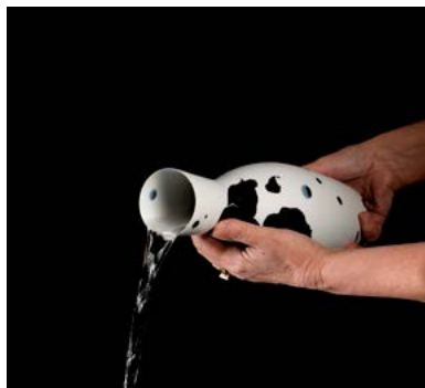
31,5cm, 1,25 litre, porcelaine, 2020