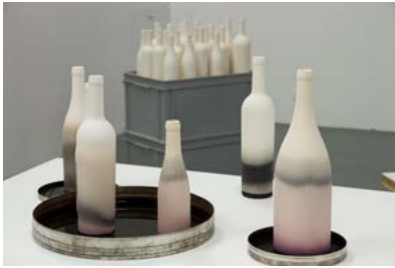
Affinités, ensemble de moulage de bouteilles de vin rouge. Porcelaine poreuse. Vin rouge. De 24 à 34 cm. 2017/2020

Précisément, cette maîtrise technique assure la réussite de ses créations, installations, mises en espaces qui jouent volontiers des faux-semblants pour placer le visiteur dans un questionnement fécond. Aline Morvan expérimente autour des propriétés des matériaux pour se lancer dans « l'exploration renouvelée de contrées familières » (Damien Delorme). Dans la série des « Affinités », Aline Morvan laisse le temps et le vin travailler en imprégnant peu à peu, par capillarité, les bouteilles de porcelaine biscuitée.