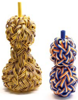
Stripe pair, porcelain, high-fired colored stain, handbuilt, 1260c oxidation firing, yellow : 14 x 14 x 26 cm, blue : 9 x 9 x 20 cm, 2019

Texte de l'artiste, extrait du catalogue :