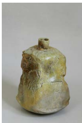
Bouteille, 12 x 12 x h 21 cm, grès, 2019